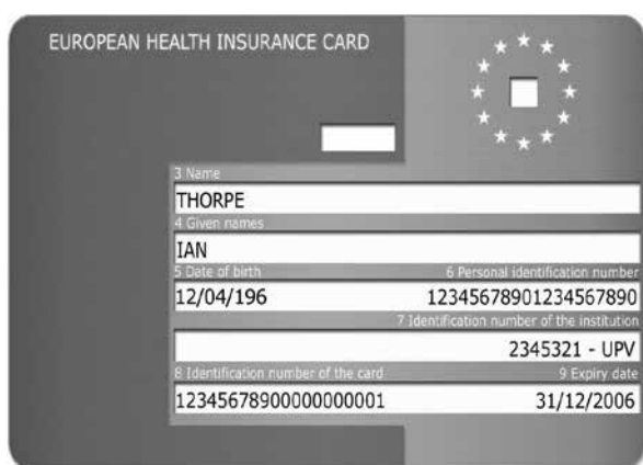
Carte européenne d'assurance maladie.

Les personnes qui tombent malades lors d'un séjour temporaire dans un Etat membre de l'UE ou de l'AELE peuvent se faire soigner sur place. L'assuré a droit à toutes les prestations en nature qui s'avèrent médicalement nécessaires lors de son séjour sur le territoire d'un autre Etat, compte tenu de la nature des prestations et de la durée dudit séjour. En d'autres termes, le patient a droit à tous les soins que son état de santé nécessite pour lui permettre de continuer son séjour dans des conditions médicalement sûres ; il ne doit pas être contraint de rentrer dans son Etat de résidence pour se faire soigner. A cet effet, il doit se procurer une carte européenne d'assurance maladie (ou un certificat provisoire de remplacement) auprès de son assureur suisse et la présenter au prestataire de soins ou à l'institution de l'Etat d'accueil.